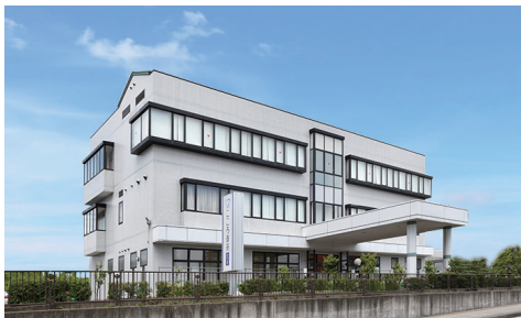
こころ斎苑 さつき 五月町 1-19