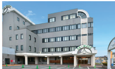
こころ斎苑 福島中央 荒町 2-10